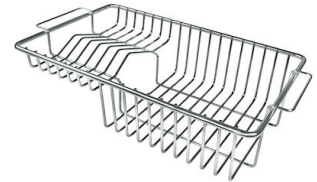
Panier à vaisselle inox 8100 201

* uniquement en combinaison avec l'accessoire 8644 101