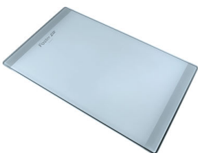
Planche de découpe en verre 8631 300